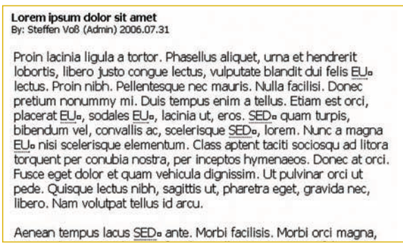
Abb. 1: Standard-Formatierung eines News-Artikels in Pagesetter